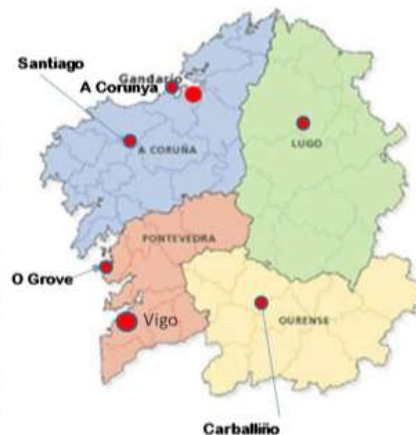
Lugar donde se han celebrado las diferentes ediciones del Foro Intercomunitario de Investigación Juvenil