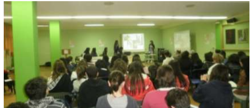
Mayo 2010. Presentación de ponencias en el salón de actos del Complejo Xuvenil As Mariñas en Gandarío (A Coruña).

Para exponer los trabajos, delante de los compañeros participantes y del público asistente, se eligió el modelo de presentación oral con apoyo tecnológico durante un máximo de 10 minutos. Se extendió también a la posibilidad de que los estudiantes puedan exponer los resultados de su investigación en talleres.