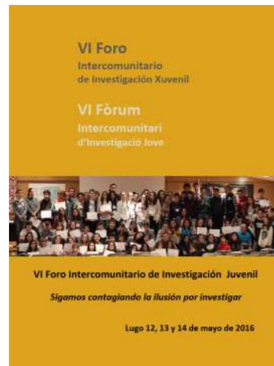
Portadas de los libros de memorias publicados en papel.

Con los años debido a la falta de presupuesto se pasó a una versión digital de la recogida de resúmenes.