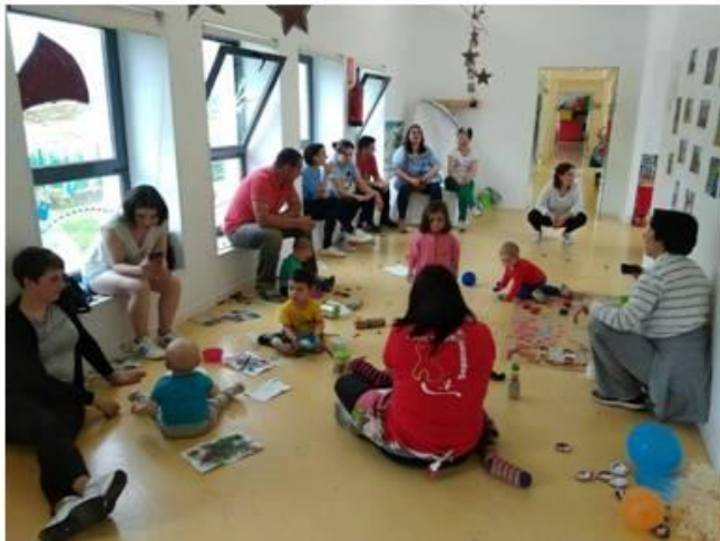
BEBEARTE (ARTE PARA BEBES)