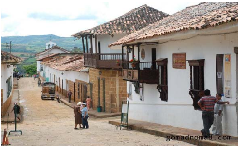
Barichalar, Santander, Colombia

Pero el aspecto fundamental para elegir San Gil y Santander, como espacio para la primera edición de FestCoop, es su amplio tejido de empresas y organizaciones cooperativas y solidarias en todo su territorio, y su compromiso con la difusión del mismo a través de la comunicación y la educación.