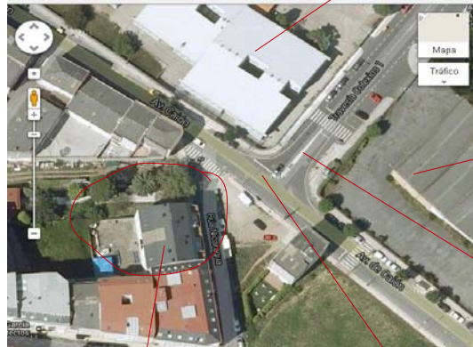
Vista aérea do local